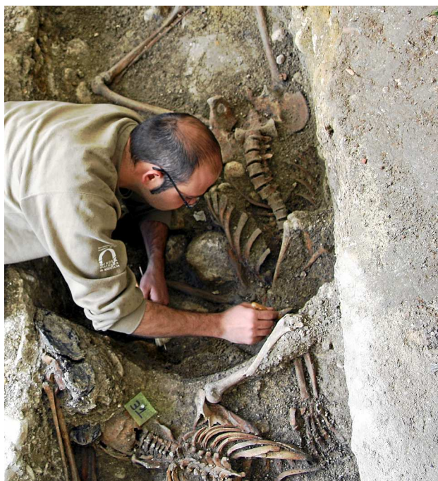
Arqueólogos, forenses y antropólogos de la ASOCIACIÓN PARA LA RECUPERACIÓN DE LA MEMORIA HISTÓRICA han exhumado 300 fosas.