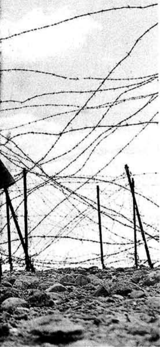
Soldados españoles de infantería patrullan frente a la valla defensiva de una ciudad del Sáhara, probablemente El Aaiún, en los años 1957-1958.

vendido por Estados Unidos. Los 200 muertos, 64 desaparecidos y 600 heridos —la mitad de los cuales probablemente murieron después— hasta ese momento era lo máximo que se podía encajar manteniendo la invisibilidad.