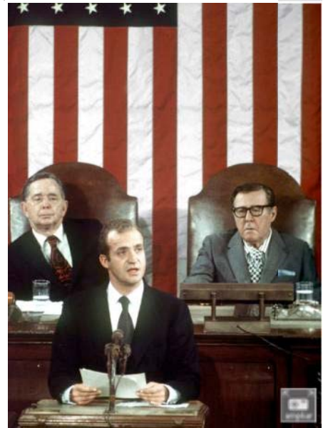
El rey Juan Carlos, en Washington durante un momento de su discurso ante el Congreso de los Estados Unidos el 2 de junio de 1976.

contaminase a otros Gobiernos europeos como para transmitir un mensaje nítido de condena por haber osado cuestionar una regla de oro no escrita del bloque occidental. A su vez, ello hizo que pensara seriamente en la posibilidad de que España ocupara su lugar, fortaleciendo así el flanco sur de la OTAN, que se vería debilitado todavía más por el conflicto chipriota. Al mismo tiempo, la caída de la dictadura portuguesa fue interpretada en el Departamento de Estado como evidencia de que el inmovilismo