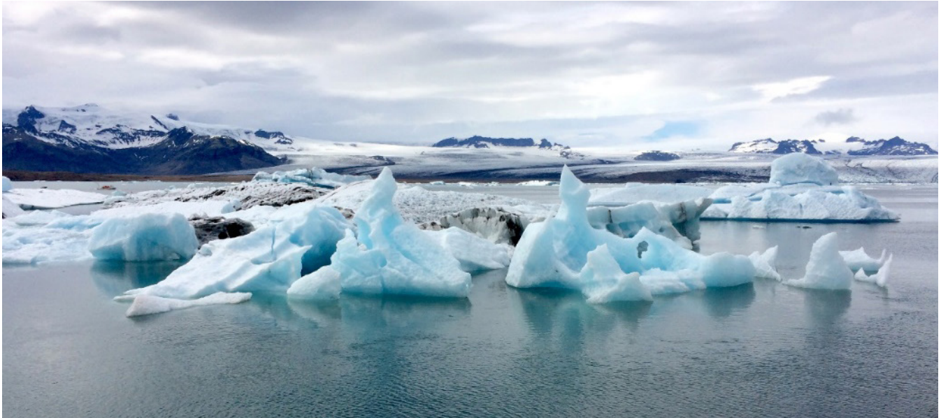
Figura 1.2. El comportamiento anómalo del agua sólida, que tiene una densidad menor que el agua líquida, es lo que hace posible que floten los icebergs. Calcular la parte que se encuentra sumergida de un bloque de hielo es un ejercicio sencillo de aplicación del principio de Arquímedes.